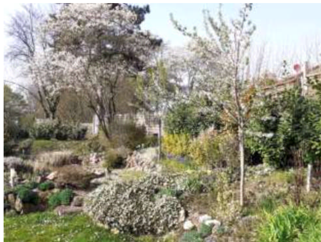
Garten in voller Blüte – Frühjahr 21

Um Sie auf den Neubeginn zu motivieren, hier einige Bilder vom Garten und der Saunaanlage (nur im Falle Sie dies in der langen Zeit der Corona-Schließung vergessen haben)?